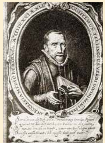
Willem Teellinck, Vader van de Nadere Reformatie

proeflezing, door opnieuw een andere persoon dan de vertaler en de proeflezer. Dit om ervoor te zorgen dat het geestelijk erfgoed van de Reformatie zorgvuldig wordt overgedragen naar de huidige tijd.