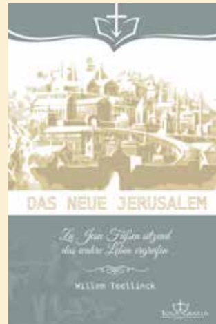
Duitse uitgave van Het nieuwe Jeruzalem.

Bij het vertalen van dergelijke werken heeft de vertaler verschillende hulpmiddelen nodig, dat wil zeggen naast een standaardwoordenboek een lexicon van synoniemen, een historisch woordenboek (omdat sommige termen tegenwoordig niet meer voorkomen), een Bijbel in het Duits (Luther, 1912) en het Nederlands (Statenvertaling) en hier en daar ook een contextvergelijking (digitaal) om na te gaan of er soortgelijke formuleringen in andere werken voorkwamen. Het doel is om dicht bij het origineel te blijven, maar ook dicht bij de Bijbel. Niettemin moet de tekst begrijpelijk en vlot leesbaar zijn voor de lezers van vandaag. Dit gebeurt niet alleen door te controleren op theologische nauwkeurigheid, maar ook door proeflezen (gewoonlijk, of indien mogelijk, door opgeleide theologen). De laatste taalkundige oppoetsing en de spelling- en interpunctiecontroles worden dan uitgevoerd in de laatste