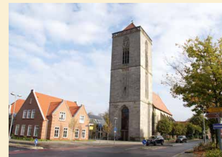
Evangelisch Reformierte Kirche Neuenhaus