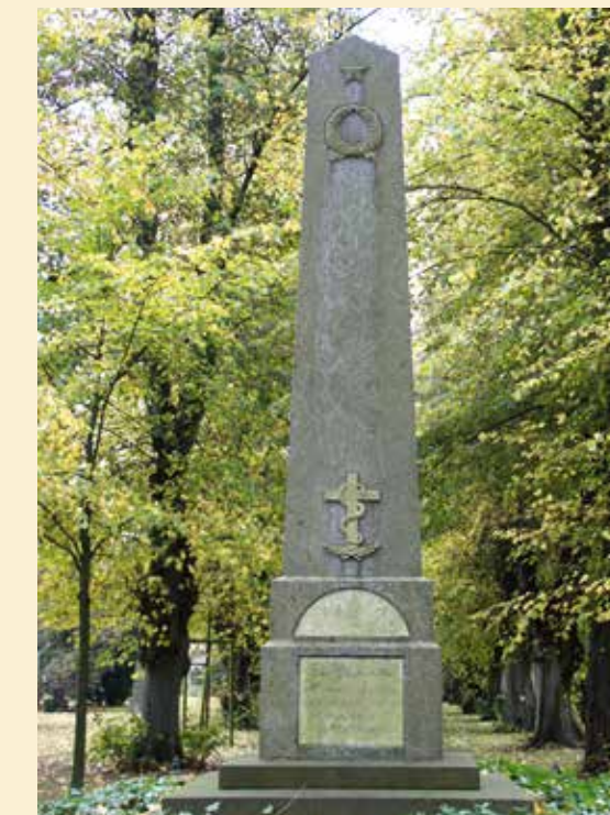
Gedenknaald Hendrik van Zutphen